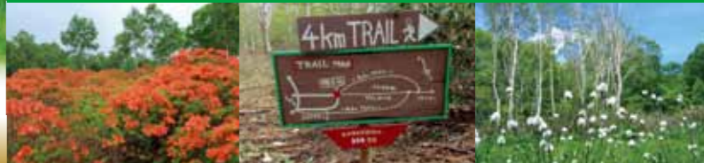
レンゲツツジ 4kmトレイル 花咲湿原

フデリンドウ 5月下旬~6月上旬 ベニバナイヤクソウ 6月中旬~6月下旬 チゴユリ 6月中旬~6月下旬 レンゲツツジ 1万5千株 (東天然記念物) 6月中旬