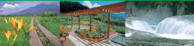
尾瀬 花の駅・花咲の湯 吹割の滝